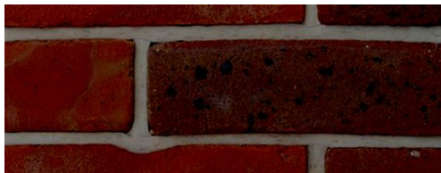
Phần cứng Mở