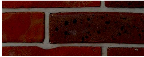
Kiến trúc Mở